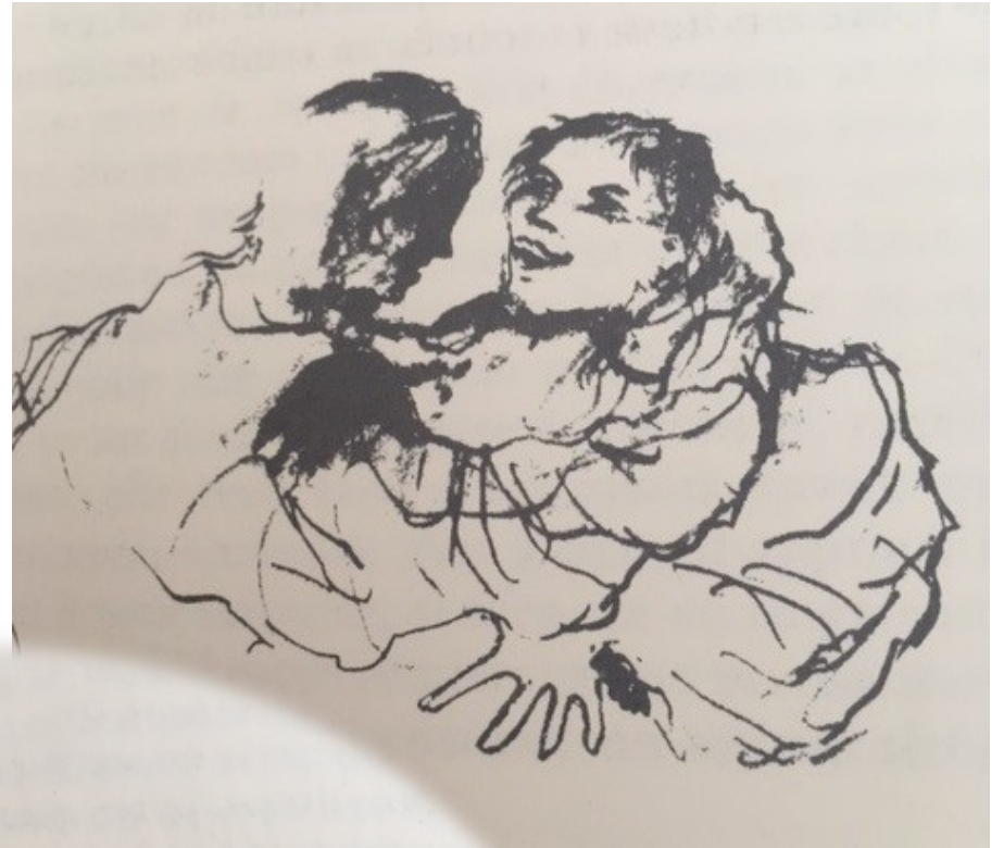
Le clair amour et l'innocence