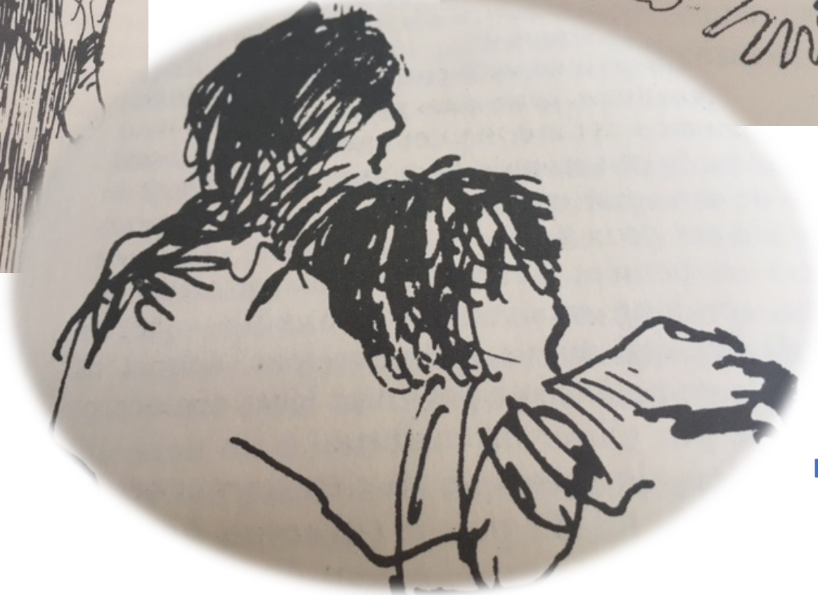
Le pauvre amour en chair